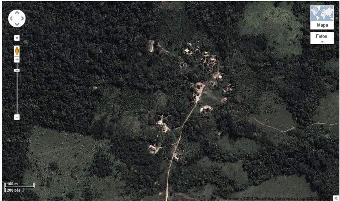
Figura 2 – Imagem aérea da aldeia Amaral